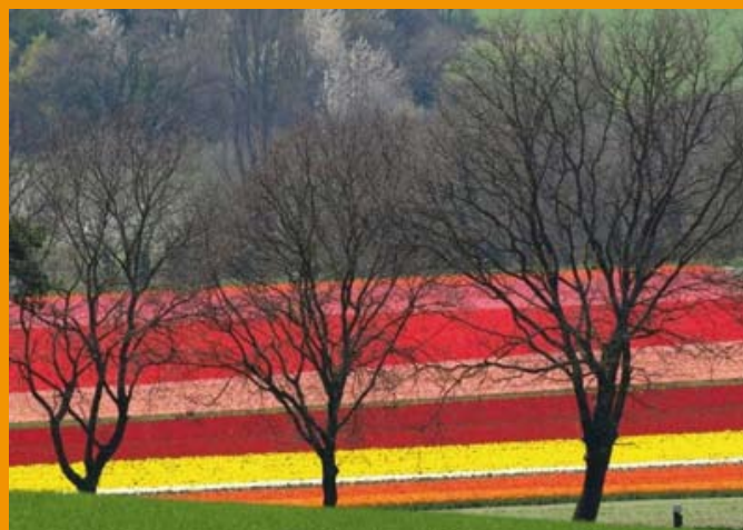
Les Tulipes 2