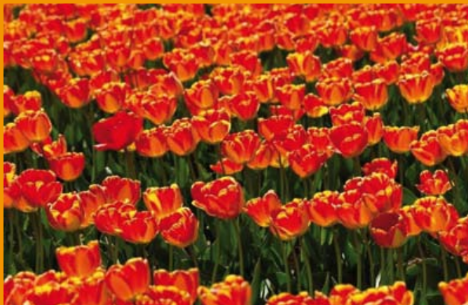
Les Tulipes 1